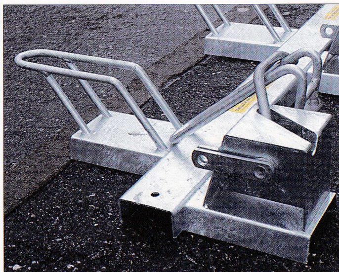
Turva-Max polkupyöräteline lukitusasennossa.

Teline on ns. puoliautomaattinen pyöräteline. Sen käyttö tapahtuu vain polkupyörän omaa lukkoa käyttäen, lisä- ja talvilukitus erillisellä riippulukolla. Käyttö verrattavissa perinteiseen pyörätelineeseen erona vain se, että pyörä työnnetään paikalleen takapyörä edellä ns. kauhaan ja siitä edelleen takatuentaan paikalleen. Pyörän irrotus tapahtuu päinvastaisessa järjestyksessä. Ensin pyörän oma lukko auki ja sitten pyörä vedetään normaalisti pois telineestä.